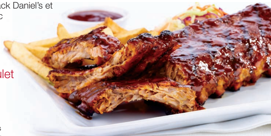
Fameuses côtes levées Casey's

Un quart de poulet rôti (poitrine) et un demi-carré de nos succulentes côtes levées de dos lentement grillées, servis avec frites, salade de chou et sauce barbecue. Cuisse 21,99 $