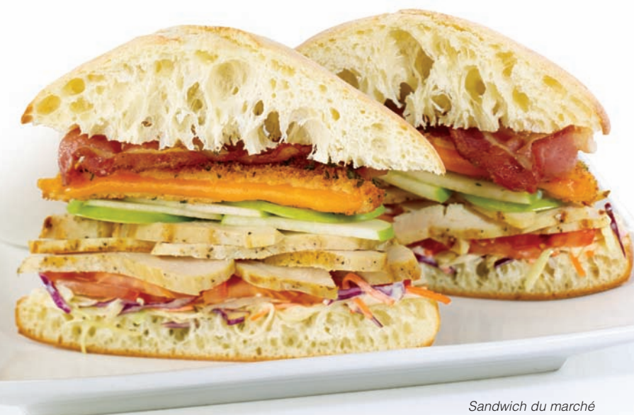
Sandwich du marché