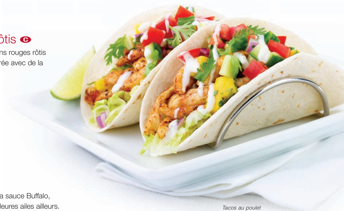
Tacos au poulet

Brie Saint-Raymond-de-Portneuf vieilli, grillé puis, garni de pesto. Servi avec des crostinis à l'ail rôti. 11,99 $