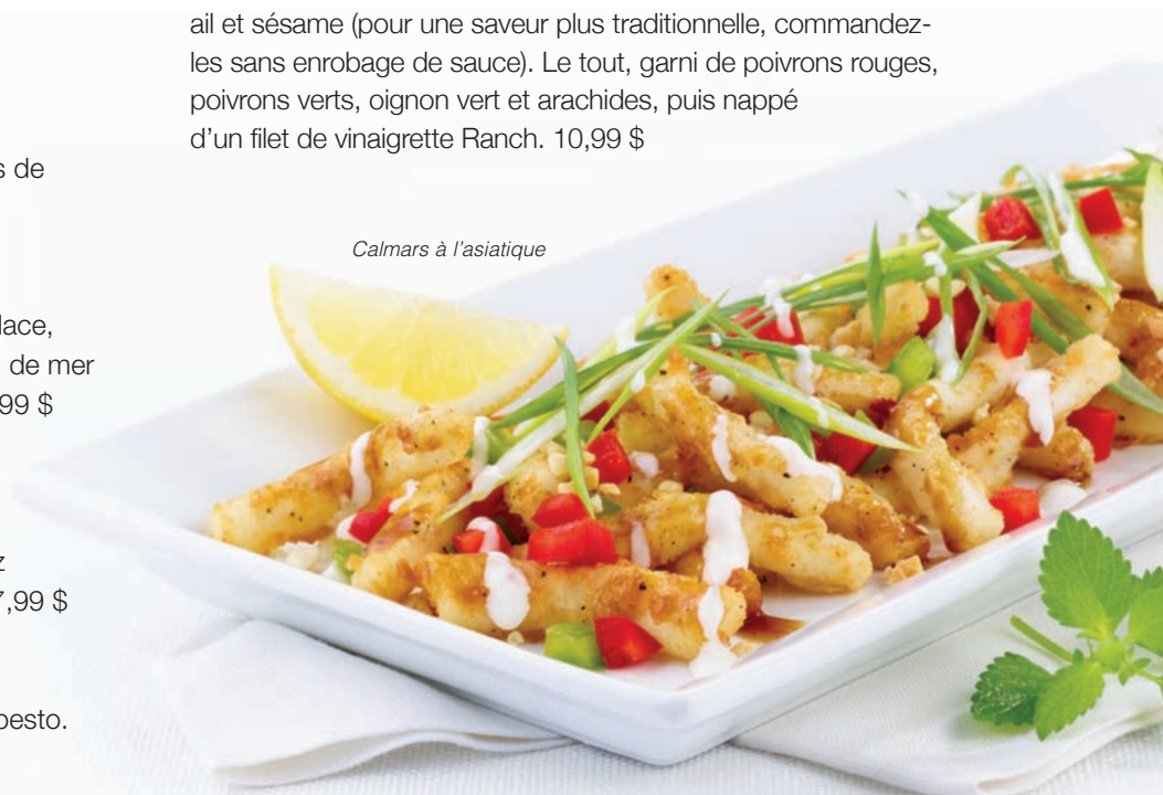
Calmars à l'asiatique

Taxes en sus. Les restaurants Casey's utilisent de l'huile sans gras trans dans ses friteuses. Certains produits peuvent avoir été en contact avec des noix, ou en contenir. Demandez à votre serveur.