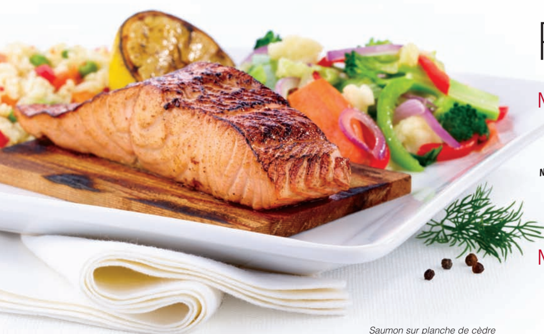
Saumon sur planche de cèdre

Morue enrobée d'une panure tempura croustillante et servie avec salade de chou, sauce tartare et frites assaisonnées de sel marin. Portion double 13,99 $ Portion simple 10,99 $