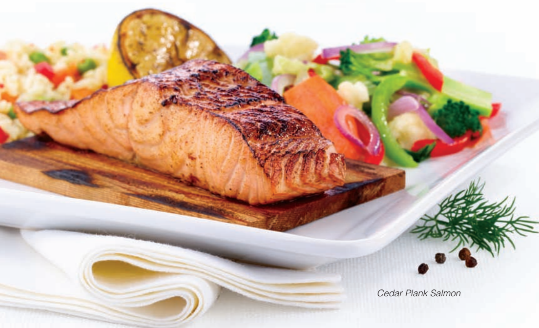
Cedar Plank Salmon

Snap peas, broccoli, green beans, baby bok choy, red peppers, onions and tofu stir-fried in a ginger teriyaki sauce. $13.99 Add shrimp. $16.99 Add seasoned chicken. $15.99