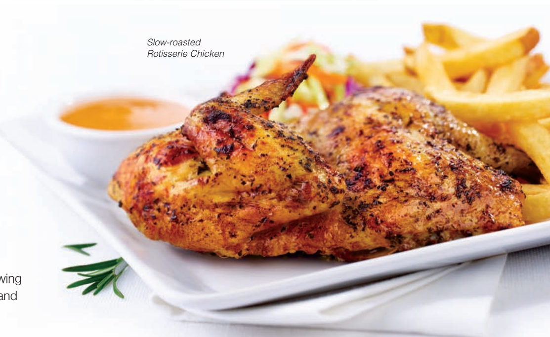
Slow-roasted Rotisserie Chicken

Our sizzling 1/2 lb. of fajitas with sautéed vegetables, sour cream, Cheddar and Jack cheeses, salsa, guacamole and warm tortillas. $18.99