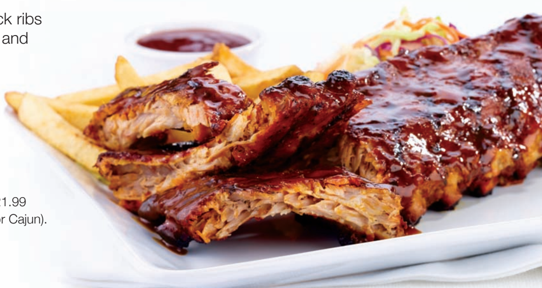
Casey's Famous Back Ribs