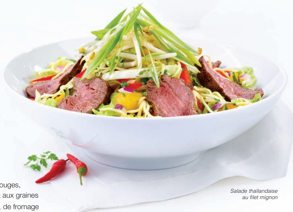
Salade thaïlandaise au filet mignon

Pois mange-tout, brocoli, fèves vertes, minis pak-choï, poivrons rouges, oignon et tofu sautés dans une sauce téryaki au gingembre. 13,99 $ Ajoutez des crevettes. 16,99 $ Ajoutez du poulet assaisonné. 15,99 $