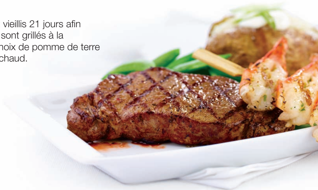
Contre-filet de 10 oz avec une brochette de crevettes grillées

Ajoutez une brochette de crevettes grillées. 5,99 $ Ajoutez une salade César ou une salade resto. 3,99 $ Ajoutez des champignons sautés. 2,99 $