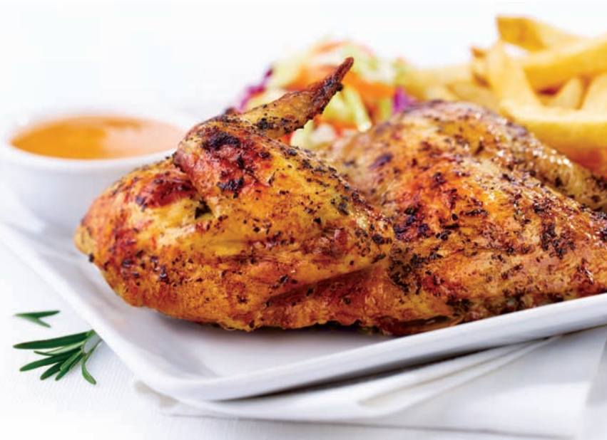
Poulet de la rôtisserie lentement rôti

Notre demi-livre de fajitas servies bien grésillantes avec légumes sautés, crème sure, fromages cheddar et Monterey Jack, salsa, guacamole et tortillas bien chaudes. 18,99 $