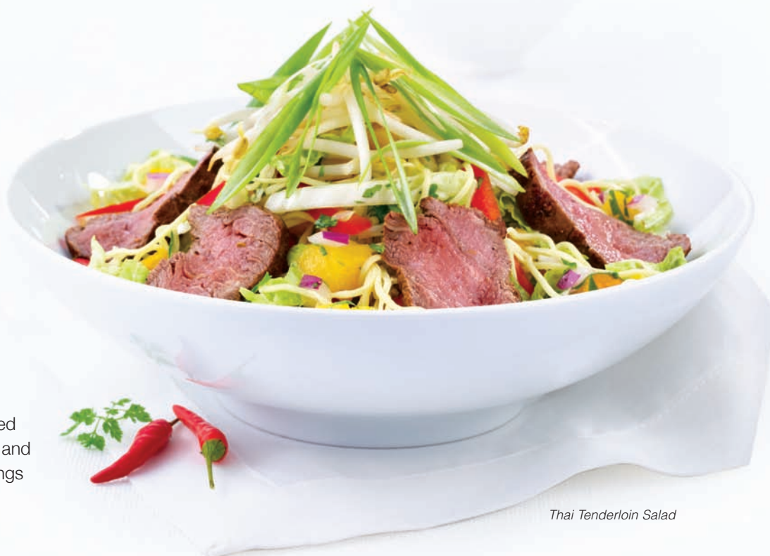
Thai Tenderloin Salad

Crisp romaine lettuce and bacon bits tossed with our original Caesar dressing, Parmesan cheese, garlic crustini and grilled seasoned chicken breast. $12.99 Lose the chicken. $9.99