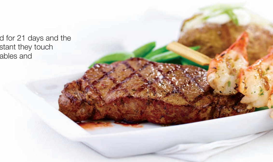
10 oz. New York Steak with a Grilled Shrimp Skewer

Add a grilled shrimp skewer. $5.99 Add a side Caesar or house salad. $3.99 Add sautéed mushrooms. $2.99